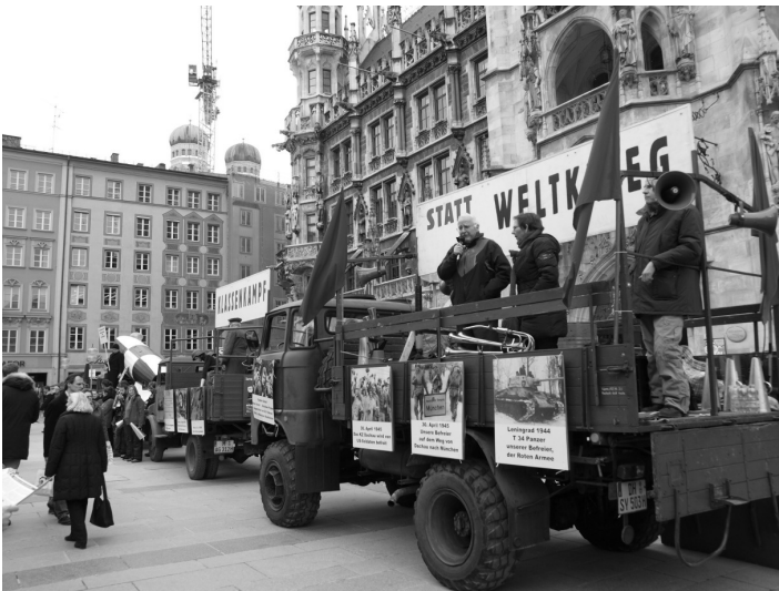
21.2.2015, Antikriegszug auf dem Münchner Marienplatz

Es sind einige Milliarden unseresgleichen auf der ganzen Welt, die kein Interesse am Krieg haben und nur ein paar wenige, die von ihm profitieren. Aber das allein hat bisher auch noch keinen Krieg aufgehalten. Das muss man schon organisieren, den Friedenskampf, den Kampf gegen Rassismus und Faschismus. Und bekanntlich fängt man erst mal klein an. Wir haben begonnen, gemeinsam mit alten und jungen Kollegen aus der tschechischen und polnischen Republik, die Fahrt, die Aufklärung und den praktische Kampf aufzunehmen. Mit einem Konvoi aus Lastwagen machen Kinder, Jugendliche und Arbeiter gerade gemeinsam einen Aktionszug durch mehrere Länder. Durch ein politisches Straßentheater, mit Musik, Reden und vielem mehr, wehren wir uns gegen die deutsche Kriegsvorbereitung. Dabei arbeiten und kämpfen wir zusammen mit unsereins aus den anderen Ländern, weil wir wissen, dass uns weder eine andere Hautfarbe, Ländergrenzen, noch eine Religion voneinander trennen, sondern nur ein Riss zwischen Arm und Reich auf der Welt