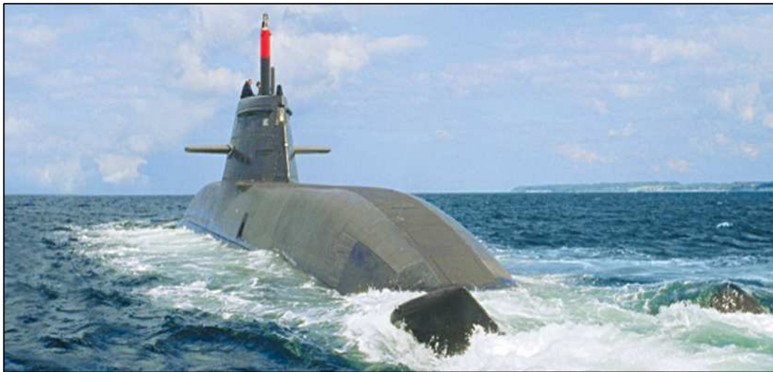
U 212 A