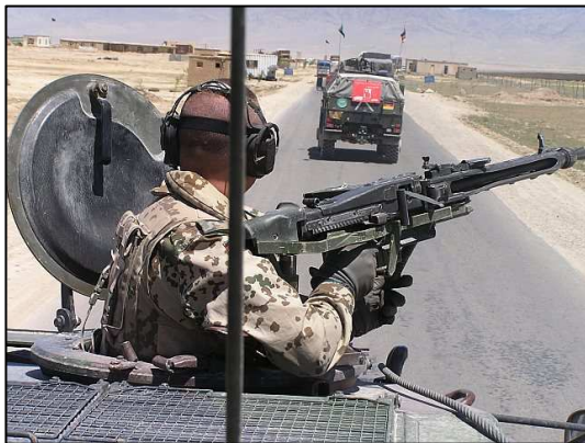
Einsatz des Multinationalen Korps Nord-Ost in Afghanistan