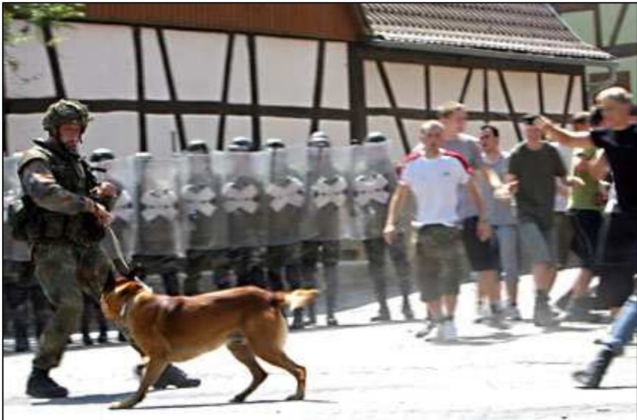
„Der Umgang mit deiner Revolte wird geübt“