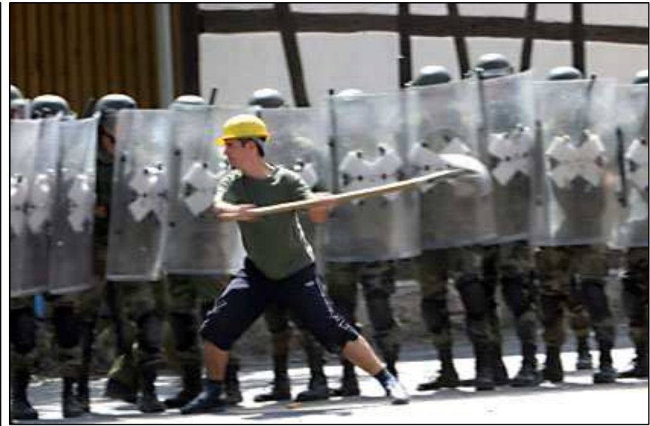
„Ein Demonstrant schlägt auf Soldaten ein“